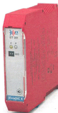
ET (7)381, ET (7)382, ET (7)383