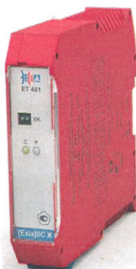
ET (7)481, ET (7)482