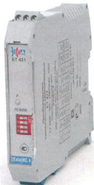
ET (7)421, ET (7)422