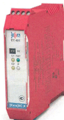
ET (7)491, ET (7)461